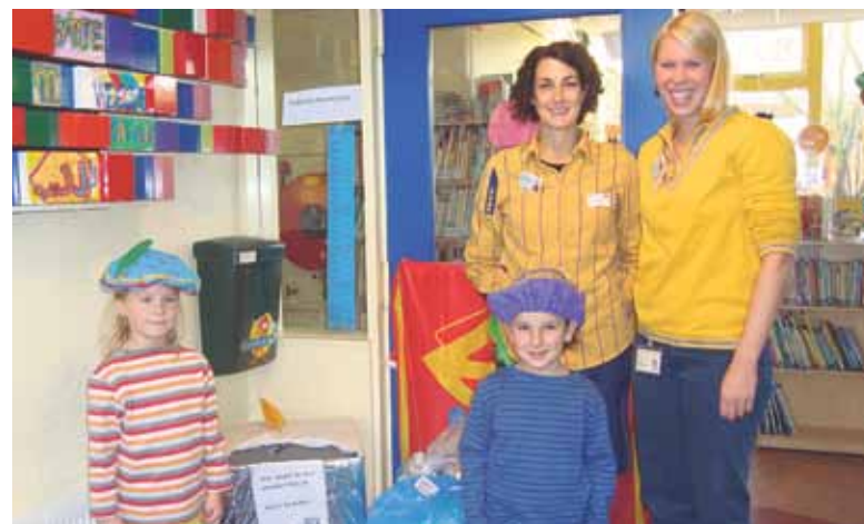
Inzameling op de Daltonschool.

Aluminium is materiaal dat steeds opnieuw kan worden gebruikt. Wanneer het in de natuur terecht komt, kan het heel schadelijk zijn. Hergebruik is ook beter omdat de productie van (nieuw) aluminium veel energie kost.