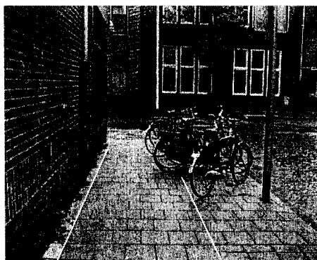
Oplossing ter hoogte van Café 'De Hugo' (plaatsing onder 45°)

Er wordt onderkent dat ter hoogte van Café 'De Hugo', bij onzorgvuldig gebruik, een situatie kan ontstaan waarin mensen met een rolstoel of brede kinderwagen hinder kunnen ondervinden. Door de fietsnietjes onder een hoek van 45° te plaatsen kan de vrije ruimten tussen fiets en gevel worden vergroot tot 1,50 m. De door u gesignaleerde problemen worden hierdoor opgelost. In ons vorige antwoord hebben wij reeds aangegeven dat deze relatief eenvoudige oplossing de voorkeur van het college heeft.