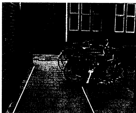
Vrije ruimte bij plaatsing onder 45° 1,50 m. (exclusief 0,15 m. obstakelzone)

Gegeven de minimale vrije trottoirbreedte van 1,20 m voor rolstoelers, biedt de voorgestelde oplossing voldoende ruimte om, ook bij wat minder zorgvuldig gebruik, rolstoelers en (tweeling)kinderwagens ongehinderd te laten passeren.