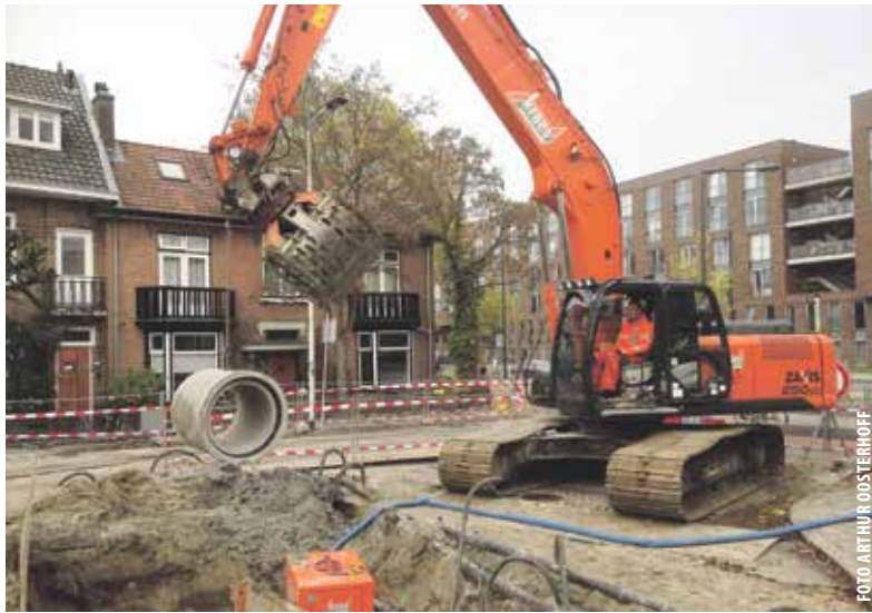
Rioolwerkzaamheden op de Julianalaan.

Voor benodigde maatregelen in de periode 2017-2020 trekt Delft een bedrag van € 60 miljoen uit. Dit leidt niet tot verhoging van de rioolhef-